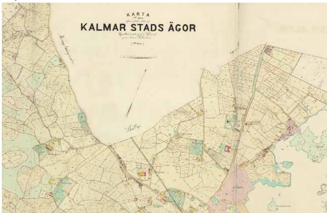
Jordbruksmark och sommarnöjen utanför Kalmar stad, 1868. Karta: Lantmäteriet.

Med stadens utbyggnad inkorporerades allt fler sommarställen i stadsbebyggelsen. Uthus och jordbruksbebyggelse revs, trädgårdar styckades av och bebyggdes eller förvandlades till allmänna parker. Idag är det få spår efter sommarnöjena som fortfarande kan läsas ut i stadsbilden. Det bäst bevarade exemplet i Kalmar är Krusenstiernska gården med rötter i 1700-talet. Bland 1800-talets mest kända sommarnöjen finns Carlsberg, Lindsberg (nuv. Folks park), Rostad och Monte Cavallo.