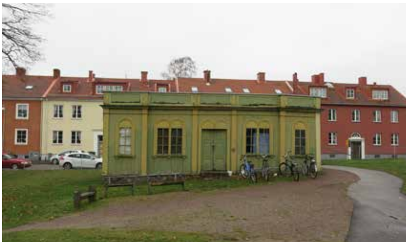
Sett från Ö.

Paviljongen antas vara i stort sett oförändrad sedan uppförandet, men präglas idag av eftersatt underhåll. Skadebilden med bl.a. rötskador i syllstockar och fönsterbågarnas understycke är typisk för den typen träbebyggelse. Dessa delar är emellertid lätta att byta ut och byggnaden skulle utan vidare kunna återställas till fullgott skick.