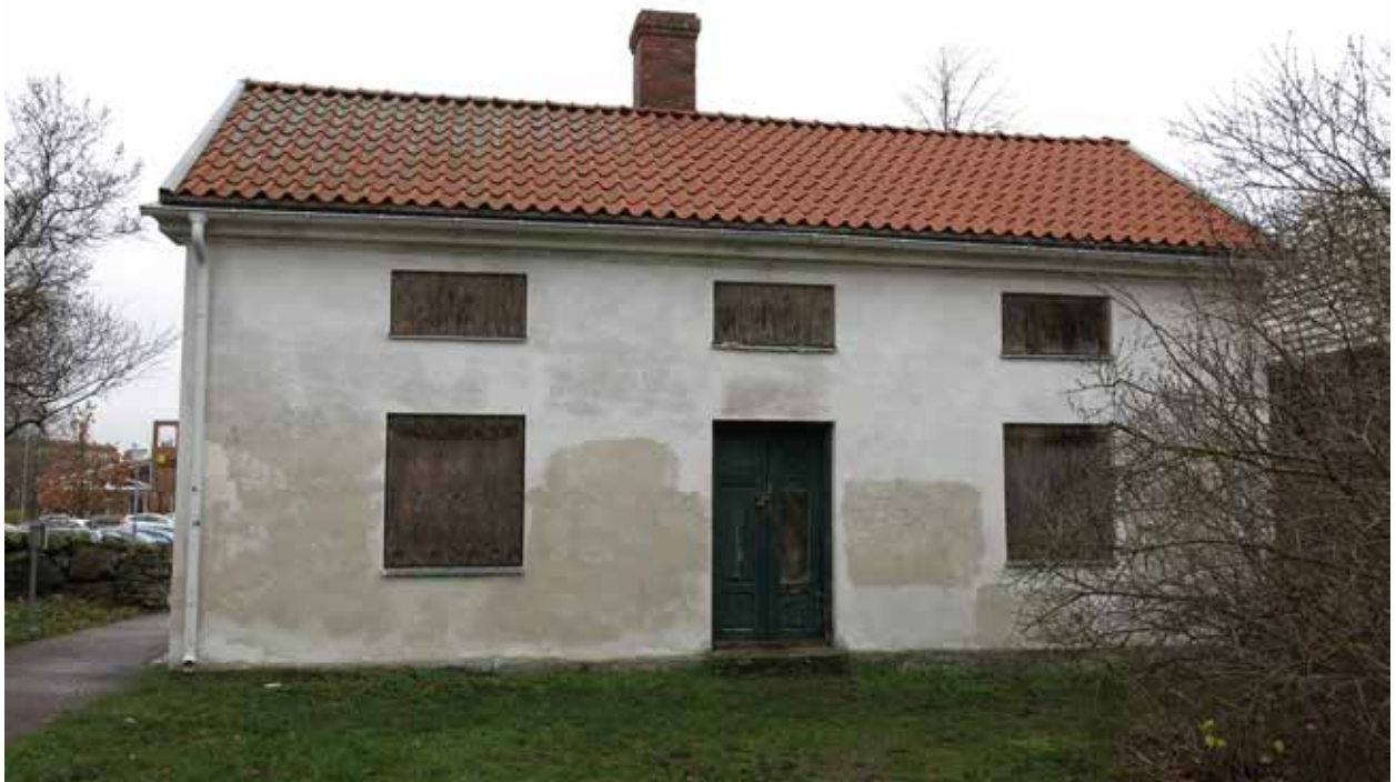
Sett från S.

Brygghuset på Carlsberg är i tekniskt bra skick med nylagt tak och bortsett från krossade fönsterrutor och otäta dörrar utan synliga skador. Fönstren är igensatta med plywoodskivor.