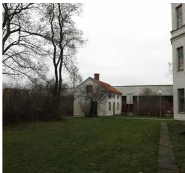
Ishallen öster om brygghuset