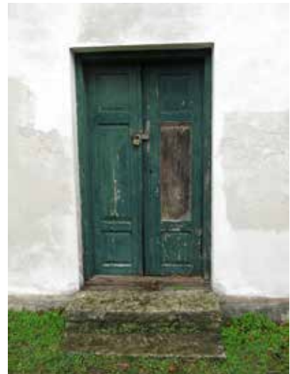
Brygghuset har många detaljer från empirtiden, bl.a. gesimsar, fönster och dörrar.