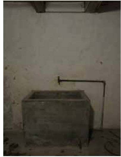
Spår efter byggnadens urspr. användning som brygghus.