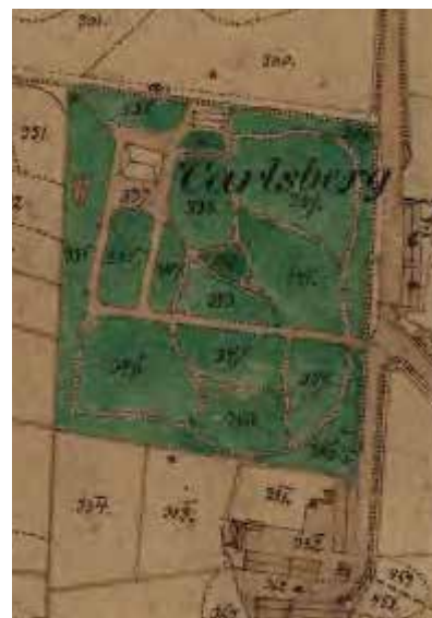
Carlsberg 1874. Karta: Lantmäteriet.

Även om Carlsberg p.g.a. ishallens påverkan på miljön inte längre är i byggnadsminnesklass så har parken stora kulturhistoriska värden och stor betydelse för upplevelsen av såväl de enskilda byggnaderna som anläggningen i sin helhet.