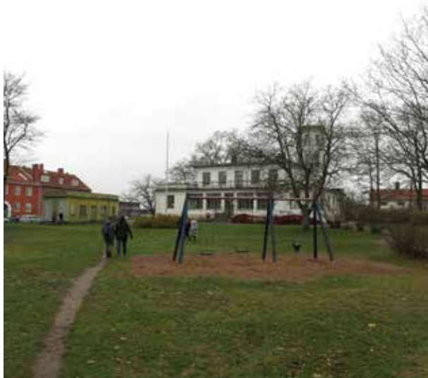
Parken med villa och paviljong som fondmotiv.