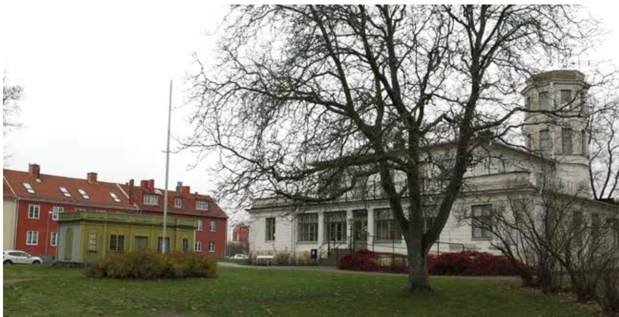
Carlsbergsvillan och paviljongen sett från SÖ.

Släkten Sundberg bodde kvar på Carlsberg fram till mitten av 1900-talet då anläggning övergick i kommunens ägo. Villan har sedan dess används som bl.a. skola och förvaltningsbyggnad. Stora delar av parken har tagits i anspråk för bl.a. sim- och ishall. De tre ursprungliga byggnaderna – villan, brygghuset och paviljongen – samt västra delen av parken är dock bevarade.